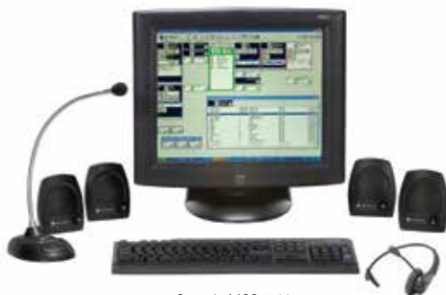
Consola MCC 7500

El nodo ASTRO 25 le permite implementar Consolas de Despacho IP MCC 7500 y MCC 7100 de Motorola y contar con encriptación de extremo a extremo extremadamente segura para todo el tráfico cursado entre operadores y usuarios en campo. La interfaz gráfica de usuario es similar a la interfaz CENTRACOM™ Gold Elite ya conocida por muchos operadores, de modo que la transición será rápida y con mínima capacitación.